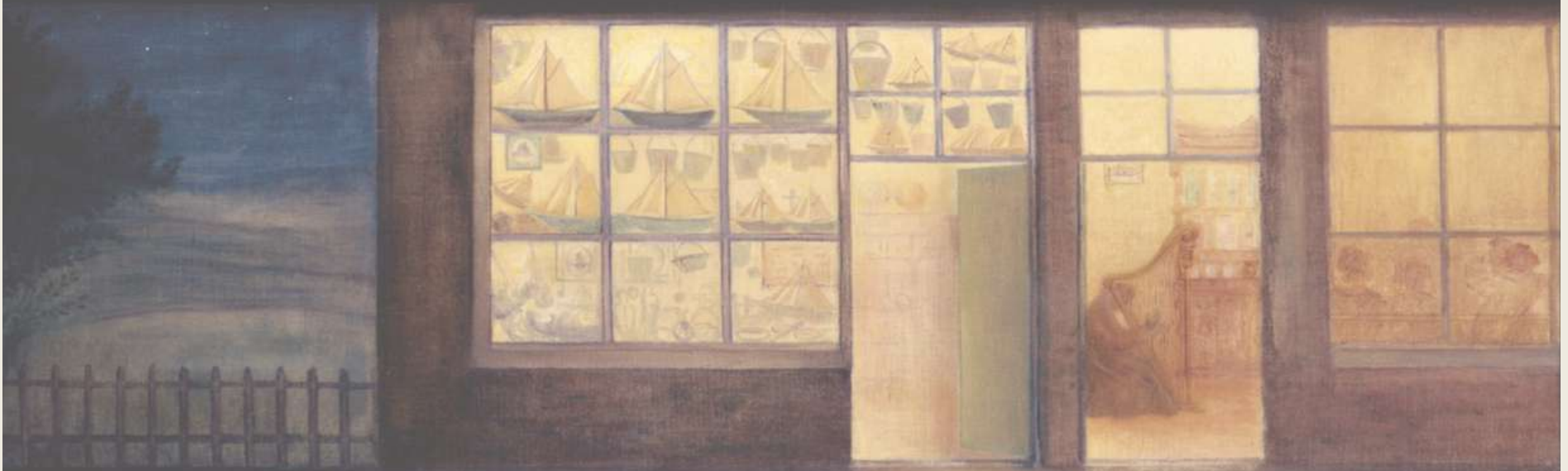
William Degouve de Nuncques, Le magasin mystérieux , 1898.

« Un trésor du symbolisme musical belge mis à jour »